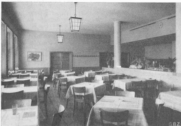
Abb. 9. Die Wirtstube, rechts das Buffet

Schliesslich wurde der japanischen Bauwirtschaft und dem Städtebau in den letzten zehn Jahren sein Charakter dadurch aufgedrückt, dass es darauf ankam, in Stadt und Dorf ausreichende Schulbauten aufzuführen. Denn mit dem Erziehungsgesetz vom 11. Oktober 1928 wurde die allgemeine Schulpflicht erst lückenlos gemacht, während bisher immer noch rund 20% der Kinder keine schulmässige Erziehung geniessen konnten. In Tokio allein wurden im letzten Jahrzehnt vier neue Schulgebäude mit 124 Klassen errichtet, in alten Schulgebäuden wurden durch Auf- und Anbauten weitere 88 Räume für Schul- und Versammlungszwecke geschaffen. Der moderne japanische Schulbau muss besonders in kleinen Städten und auf den Dörfern auch als Volksversammlungsstätte dienen können, weswegen zumeist ein Blockbau rund um einen mittleren Hof das äussere Bild dieser Bauten abgibt. Im Jahre 1932 waren noch 783 japanische Gemeinden ohne eigene Schul- und Versammlungsbauten; heute ist diese Zahl auf kaum 100 Gemeinden zurückgegangen. Fr. G. Sch.