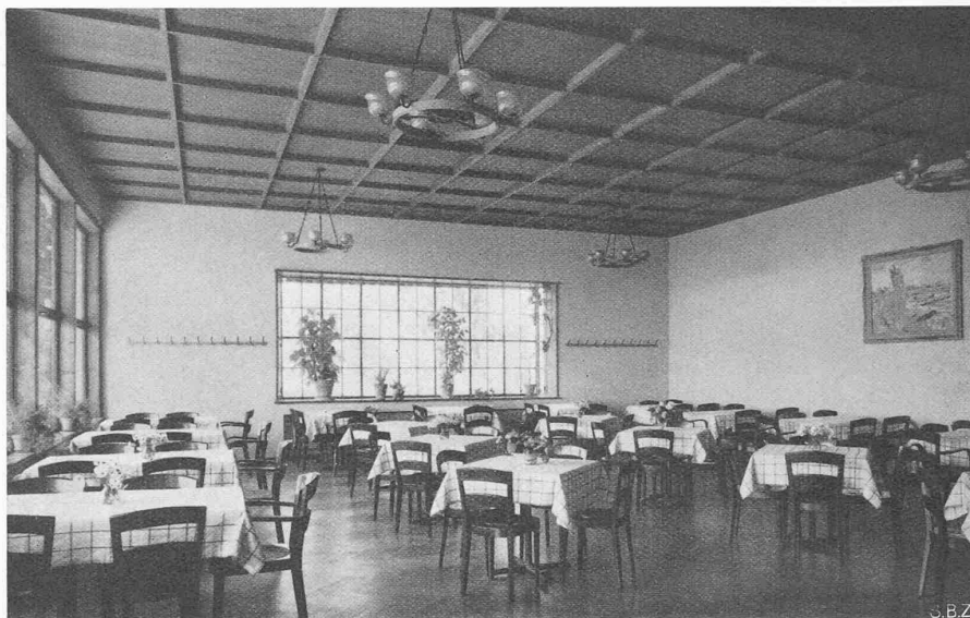
Abb. 6. Die Waidstube gegen Westen, aus der Veranda gesehen

Auf der andern Seite mussten dafür die japanischen Städte die Rückwanderer vom Lande her aufnehmen, was keine leichte Aufgabe war. Denn gewisse weitgehende Ansprüche der zwangsweise umgesiedelten Bodeneigentümer mussten dadurch ausgeglichen werden, dass man den Umsiedlern solchen städtischen