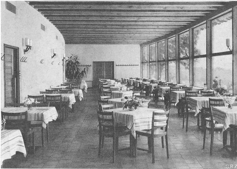
Abb. 8. Die Veranda der neuen Wirtschaft zur Waid in Zürich

gesehen von der Verdoppelung der Aufnahme-fähigkeit seines Kriegshafens.