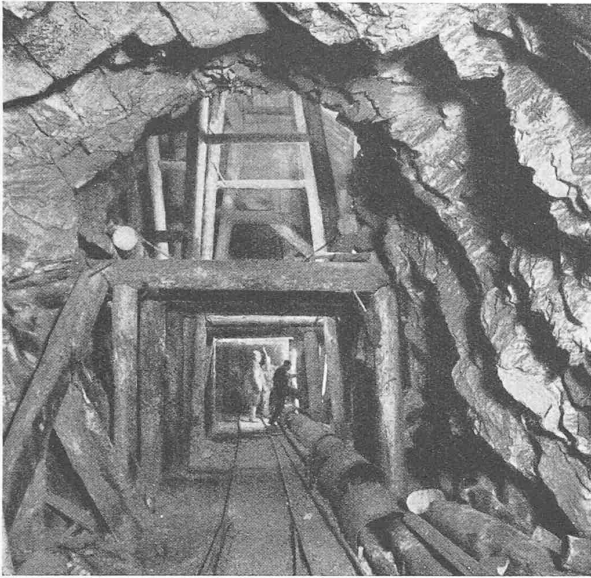
Abb. 1. Typisches Stollenbild des westl. Massagno-Tunnel

Auch damals galt es, die Schweiz zu rüsten für den nach Kriegsende zu erwartenden neuen Aufschwung des internationalen Reiseverkehrs und für die Vorbereitung des neutralen Bodens, auf dem sich die ehemaligen Kriegsgegner zum erstenmal wieder begegnen und die Hände reichen konnten. Möge die Aehnlichkeit zwischen der damaligen Schaffung der SVZ und der nunmehrigen Entstehung der SZV zum Symbol dafür werden, dass auch diesmal nach der Wiederherstellung des Friedens die Schweiz ihre völkerveröhnende Mission erfüllen kann. H. W. Th.