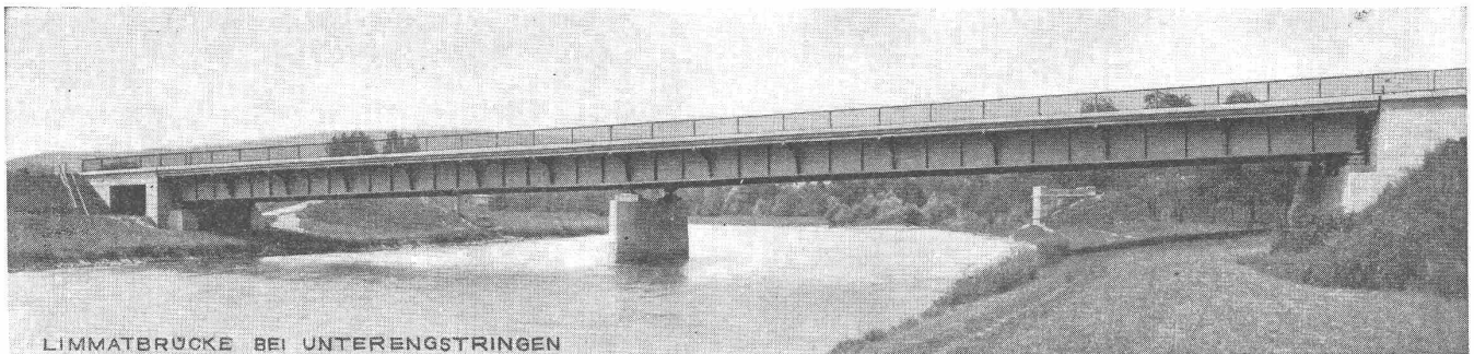
LIMMATBRÜCKE BEI UNTERENGSTRINGEN