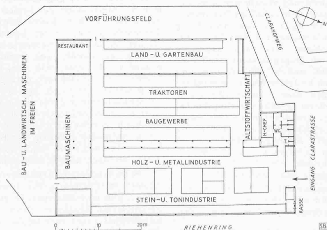
Provisorische Erweiterung für die Baumesse

Die Jubiläums-Messe will aber nicht nur der grosse schweizerische Verkaufsmarkt sein, sondern zugleich auch schweizerische National-Ausstellung. Sie will als Musterschau dem Messebesucher Markterlebnis im besten Sinne des Wortes werden. Sie will Zeugnis ablegen von der achtunggebietenden Leistungskraft des Schweizervolkes. Sie will zu neuem Leistungswillen anspornen und zur nationalen Leistungsgemeinschaft aufmuntern. Hoffnungsfreudig lenkt sie unser Aller Blicke aus dieser sorgenschweren Gegenwart in die bessere Zukunft, indem sie in den Hallen und an den Messeständen zur Verkünderin der national-wirtschaftlichen Grundwahrheit wird, dass sich unser freies und unabhängiges Land in einem neuen Europa und in einer neu aufgebauten Welt wirtschaftlich nur dann wird behaupten können, wenn es auch weiterhin qualitative Höchstleistungen vollbringt.