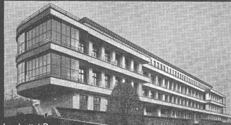
Inselspital Bern Selbsttätige Heizregelanlage System Landis & Gyr

dosiert die Heizleistung selbsttätig nach der Witterung. Sie passt sich den Erfordernissen jeden Heizbetriebs an und gestattet sparsamste Brennstoff-Verwendung.