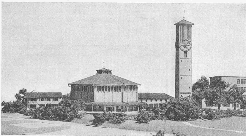
Abb. 2. Modellbild der zukünftigen Kirche Zürich-Seebach, aus Süden. Links Pfarrhaus, rechts Gemeindesaal, Turm und bestehendes Schulhaus. — Arch. A. H. STEINER, Zürich

oder -absenkung von natürlichen Seen anzuordnen; f) die in den Verleihungen und Vereinbarungen enthaltenen Vorschriften für die Füllung von Speicherseen, die der Kraftgewinnung dienen, abzuändern oder aufzuheben; g) den Inhabern der Verleihung für Speicheranlagen die Höherstauung der Speicherseen zu gestatten.»