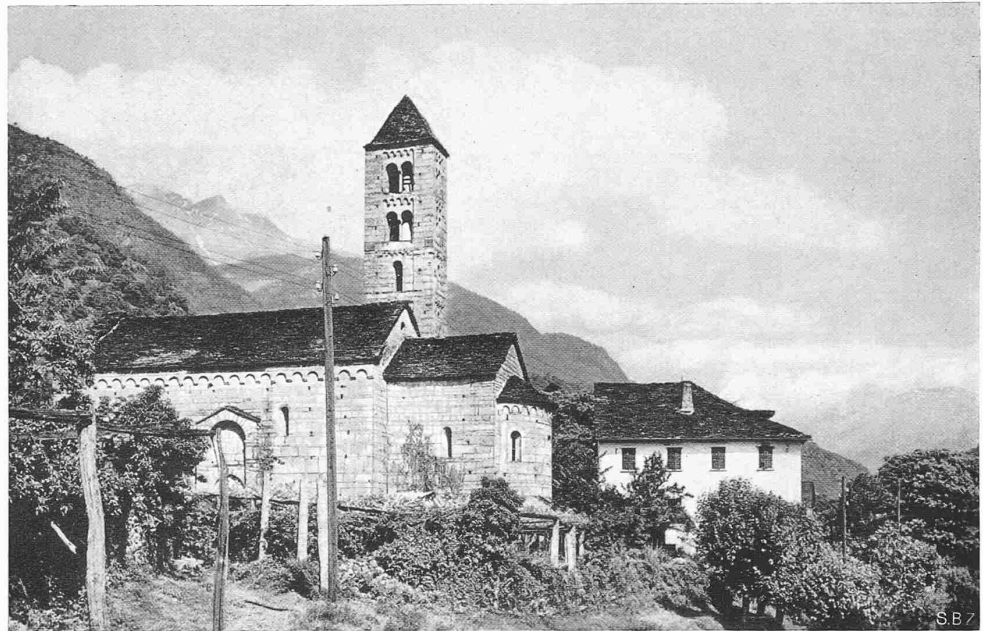
Abb. 1. San Nicolao in Giornico. Romanischer Bau aus dem XII. Jahrhundert, aus Südost

Aus riesigen Granitquadern untadelig gemauert, enthält die Kirche San Nicolao einen rechteckigen steinernen Saal von düsterer Grossartigkeit, gedeckt mit einer simplen, groben Balken-