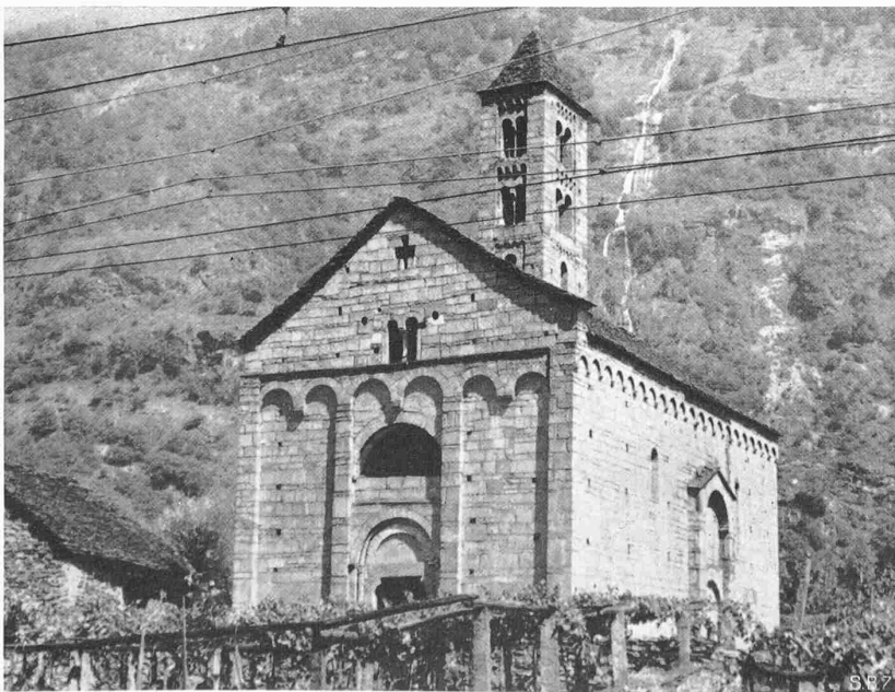
Abb. 2. Aus Südwest.

decke. Wie eine Bühne ist der Boden des Chores ungewöhnlich stark über das Schiff erhöht, sodass darunter der Säulenwald der Krypta vom Schiff aus sichtbar wird; «Wald» ist für die 14 Säulen und Halbsäulen vielleicht etwas zuviel gesagt, aber als einzige plastische Bauglieder treten sie im Kontrast zu den glatten Granitwänden stark in Erscheinung. Die Kapitäle sind entsprechend dem mühsamen Material mit einfachem Blattwerk und urweltlich primitiven Köpfen verziert; Tiere ähnlicher Art tragen die Gewändesäulen des Portals. Dazu kommt ein wunderschöner, mit seinen unteren Teilen in den Kirchenraum eingebauter kräftig-schlanker Turm, das Ideal eines lombardischen Kirchturms, wie er zum Charakterbild so vieler Tessiner Dörfer gehört und den Reisenden schon in Airole begrüsst. Ausser dem