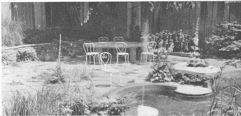
Abb. 79. Die Ecke mit dem Steintisch unter der Paulownia

Der Bildhauer hat an diesem Ort die Sorge um die Beziehungen der Dinge untereinander beigetragen. Es gibt sicher Figuren, die eines Tages einziehen könnten in diese Stube — Skulptur — von der man weiss, dass das Ausmass ihrer räum-