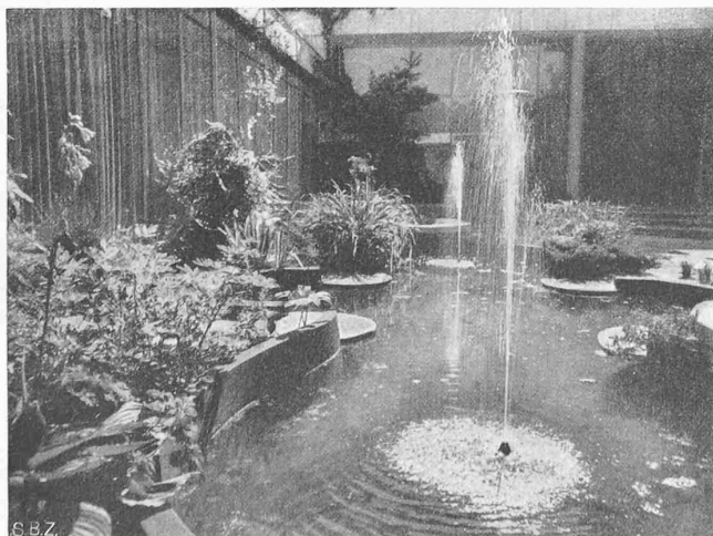
Abb. 80. Das grosse Becken