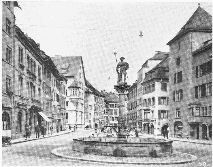
Abb. 3 (links). Das durch Arch. Walter Henne gesäuberte Bankgebäude und (Abb. 4) das heutige Platzbild, in dem nicht mehr die Bank, sondern der alte Brunnen dominiert (Abb. 2, 3, 4 Phot. Koch, Schaffhausen)