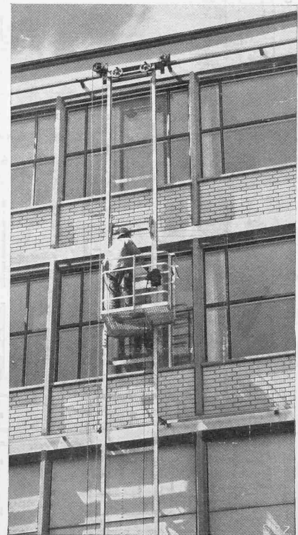
Abb. 4. Fassadendetail und Fensterreinigung