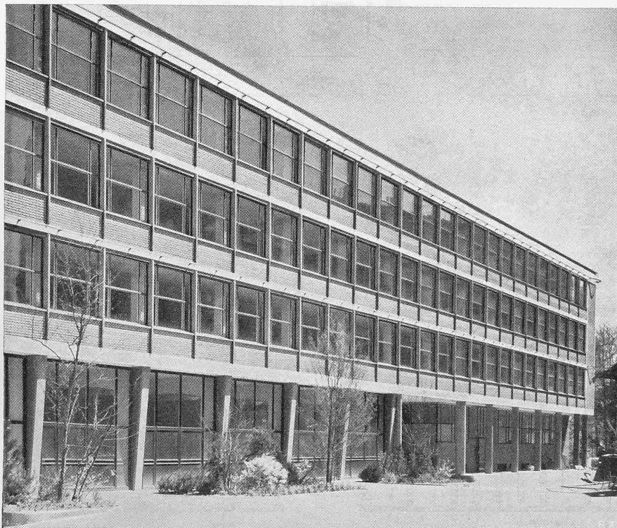
Abb. 3. Teilansicht der Vorderfront.

ohnehin schwierig gewesen, da das Gelände gegen Südwesten ansteigt. Andererseits erleichterte diese Höhendifferenz von etwa 4 m ein unmittelbares Zusammenbauen mit den Fabriktrakten, ohne die Bureaugeschosse, die einen ebenerdigen Zugang zum Erdgeschoss von Südwesten her haben, zu beeinträchtigen. Mittels zweier Durchfahrten ist die Verbindung mit den internen Fabrikstrassen hergestellt. Die Südecke des Neubaus steht relativ nahe am Schloss mit seiner grossen, dominierenden Bau-