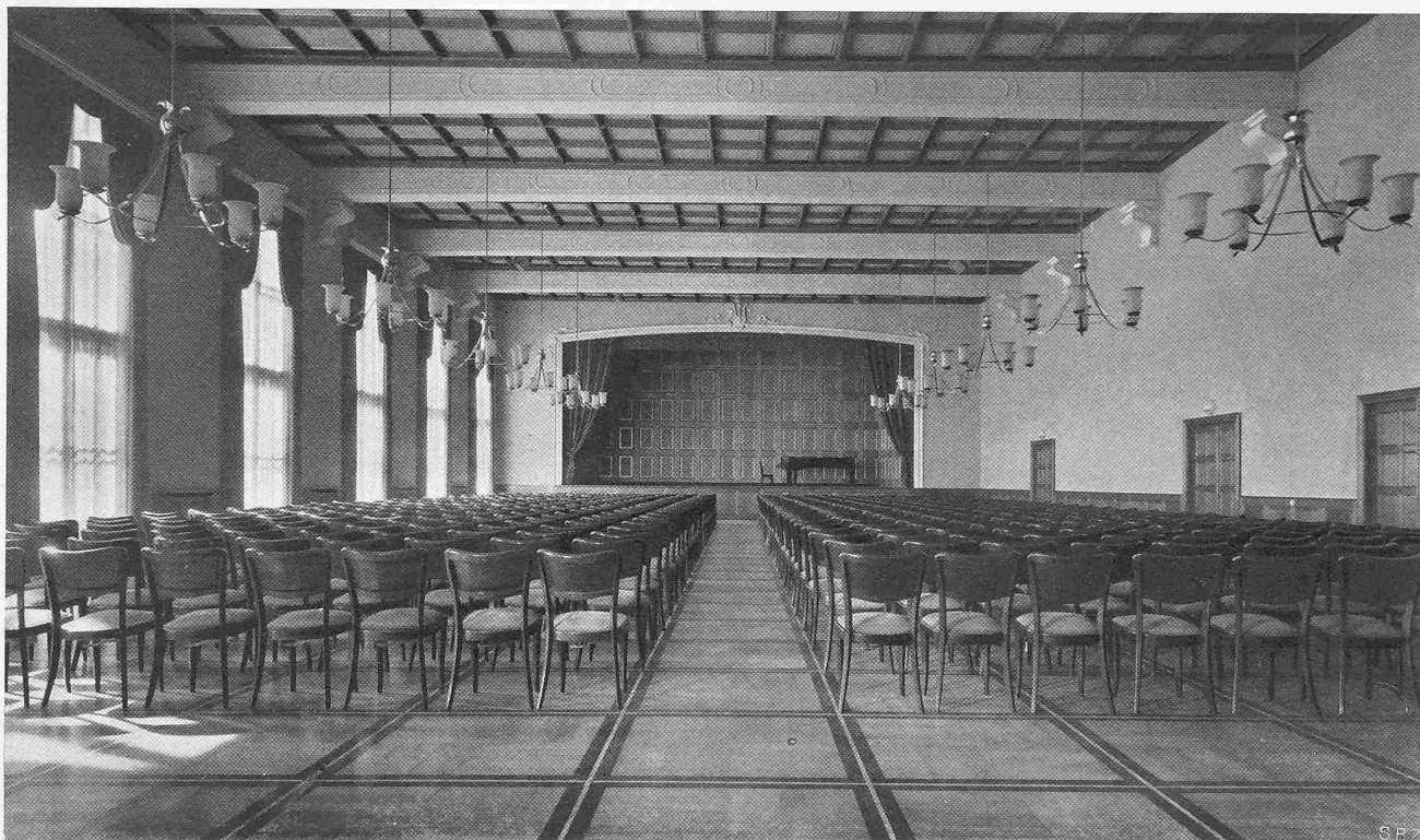
Abb. 25. Grosser Festsaal im neuen Stadtcasino, links Fenster am Steinberg. Arch. KEHLSTADT, BRODTBECK, BRÄUNING, LEU, DURIG

Vorbühnenscheinwerfern, mit Fernsteuerung von Operateurkabine und Bühne aus.