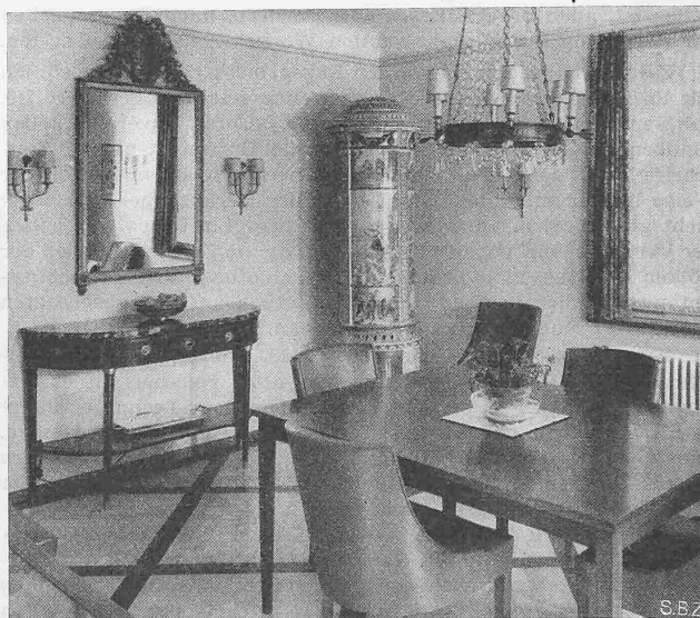
Abb. 10. Ofenecke des Esszimmers.