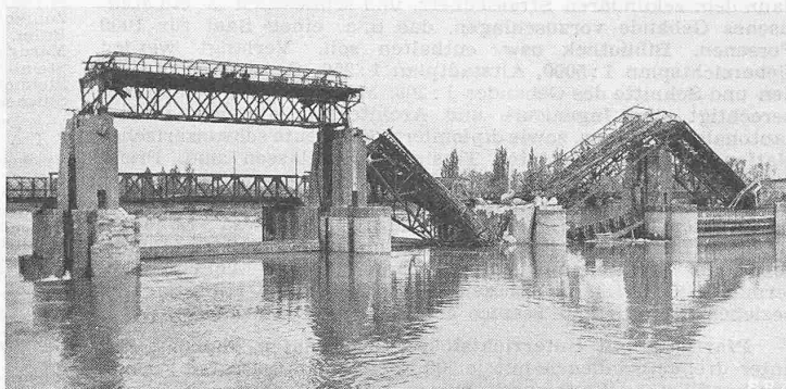
Abb. 2. Stauwehr Kembs vom Oberwasser aus, Oeffnung 1 am elsässischen Ufer. Zerstörung von Widerlager links durch Sprengung und Schütze 1 durch Bomben. Anschliessend Oeffnung 2. Im Hintergrund Notbrücke über Oeffnung 1