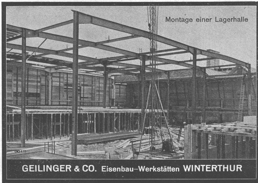
Montage einer Lagerhalle

GEILINGER & CO. Eisenbau-Werkstätten WINTERTHUR