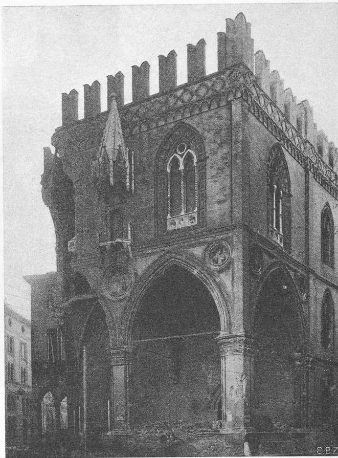
Bild 1. Loggia aus dem 13. Jahrh. am Palazzo della Mercanzia

Die einzigartige Gruppe frühchristlicher und frühromanischer Kirchen und Kreuzgänge von Santo Stefano nebst dem vorliegenden dreieckigen Platz mit seinen gotischen Häusern ist (gegenteiligen Berichten zum Trotz) vollkommen verschont geblieben; nur die Butzenscheiben gingen in Scherben. Ueberhaupt haben die Strassen d'Azeglio, Castiglione, Santo Stefano, Mazzini und San Vitale ihren Charakter voll-