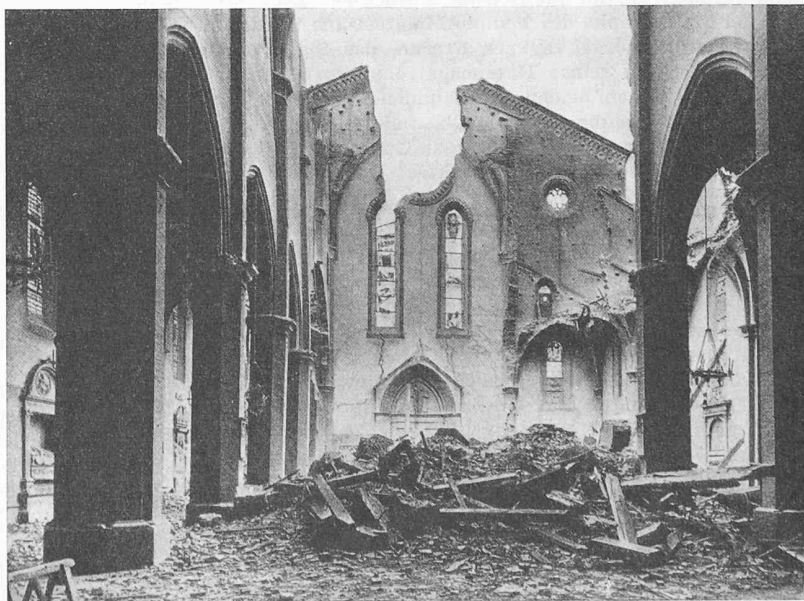
Bilder 2 und 3. Die schwer zerstörte frühgotische Kirche San Francesco in Bologna