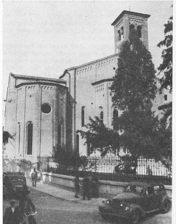
Bild 4. Die Eremitanikirche in Padua nach dem Bombardement und (Bild 5) nach dem Wiederaufbau

gegenüberliegenden frühgotischen Häuser und Türme wurden von der Explosion nicht berührt.