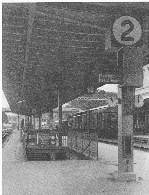
Bild 10. Zwischenperron