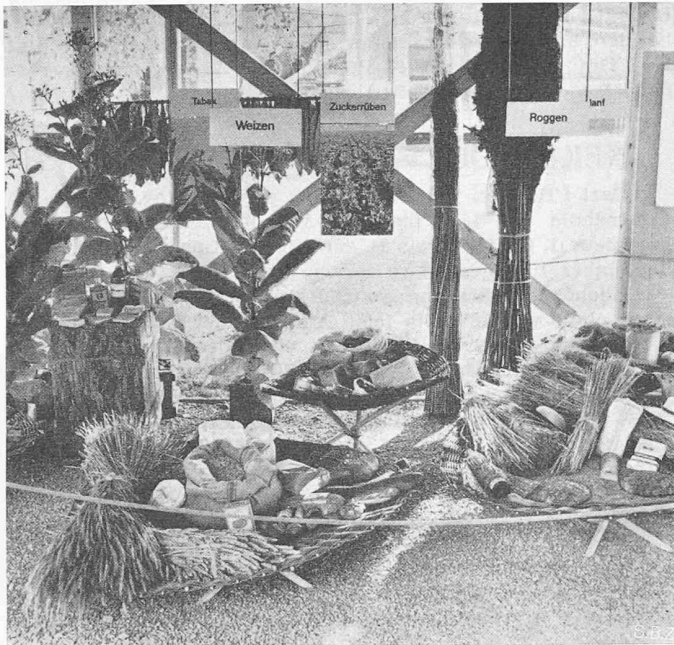
Bild 8. Eines der lehrreichen und schön aufgebauten Stilleben der Landwirtschafts-Abteilung. Hier, bei Forstwirtschaft, Weinbau usw. wurde das Material durchweg eindringlich und schön präsentiert, systematisch, aber ohne Pedanterie