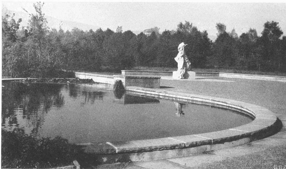
Platzgestaltung und Figur im Friedhof Zürich-Sihlfeld von Bildhauer Louis Conne, Zürich