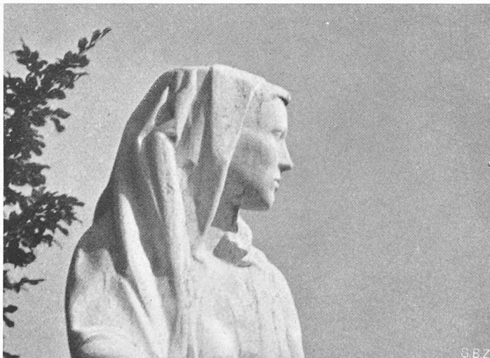
Figur von Bildhauer Franz Fischer im Friedhof Zürich-Nordheim