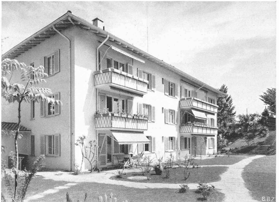
Bild 5. «Utopark», Haus an der Engemattstrasse von der Gartenseite

ment Publications Sale Office», 3—4 College St., Dublin) über zahlreiche Versuche an kleinen Dampfkesseln mit Torffeurung. Neben den Messwerten und Versuchszahlen finden sich Angaben über konstruktive Massnahmen und Betriebserfahrungen, die auch für uns interessant sind. Nachdem in Irland heute Kohle wieder verfügbar ist, wird Torf nur noch in der Nähe von Torffeldern weiter verwendet. In Irland besteht ein Torfamt (Turf Board), das sich für die Torfausbeutung interessiert und über ein Kapital von 4 Mio £ verfügt. Das Amt für Elektrizitätsversorgung (Electricity Supply Board) baut gegenwärtig zwei mit Torf betriebene Dampfkraftwerke, von denen das eine (in Portarlington, Co. Leix, 80 km von Dublin entfernt) jährlich 90 Mio kWh, das andere (in Allenwood, Co. Kildare, 40 km von Dublin) jährlich 135 Mio kWh erzeugt. Das zuerst genannte Werk wird Anfangs 1949 in Betrieb kommen. Ein drittes Werk ist projektiert.