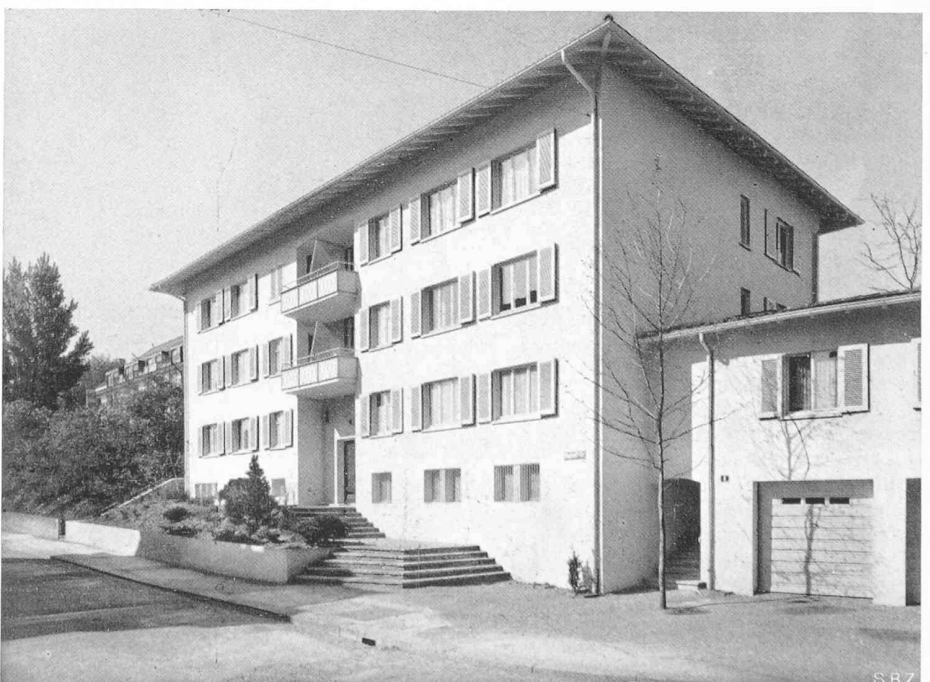
Bild 6. Haus an der Engemattstrasse, rechts Verbindungsbau

Die Stuyvesant-Wohnkolonie in New York , die von der Lebensversicherungsgesellschaft «Metropolitan Life» erstellt