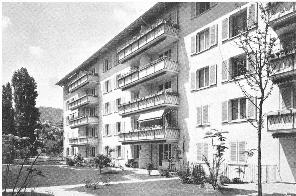
Bild 7. «Utopark», Gartenhof und Haus an der Bederstrasse. Arch. Dr. R. ROHN, Zürich

wurde und deren 35 je dreizehnstöckige Gebäude total 24000 Personen aufnehmen, ist in «Eng. News-Record» vom 5. Februar in verschiedenen Artikeln ausführlich beschrieben. In den über 500 abgebrochenen Wohnhäusern des Slum-Quartiers am East River wohnten 1943 noch 11000 Personen, meist in bedenklichen hygienischen Verhältnissen. Die neue, nur zwei Haustypen aufweisende Kolonie, in Stahlskelett-Bauweise mit Backsteinverkleidung erstellt, enthält zwölf Spielplätze, einen grossen, zentralen Park, sowie unterirdische Garagen. Der schlechte und zudem noch stark wechselnde Baugrund bedingte Platten-Fundierungen neben Pfählungen (total 42522 Ortpfähle mit Zwiebfuss). Bezüglich Bauausführungs-Einzelheiten wie Stahlkonstruktion, Platten- und Pfahl-Fundierung, Fundament- und Garagedecken-Betonierung, Skelett-Ausmauerung, Innen-