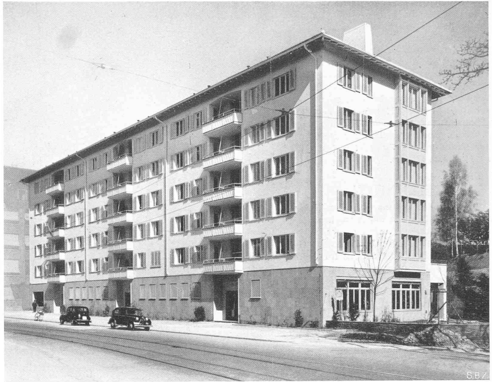
Bild 3. «Utopark», Block an der Bederstrasse, aus Westen. Arch. Dr. R. ROHN, Zürich

Konstruktion. Kellermauern hofseitig Betonmauerwerk 35 cm stark, strassenseitig Backstein 32 cm stark. Aufgehenden