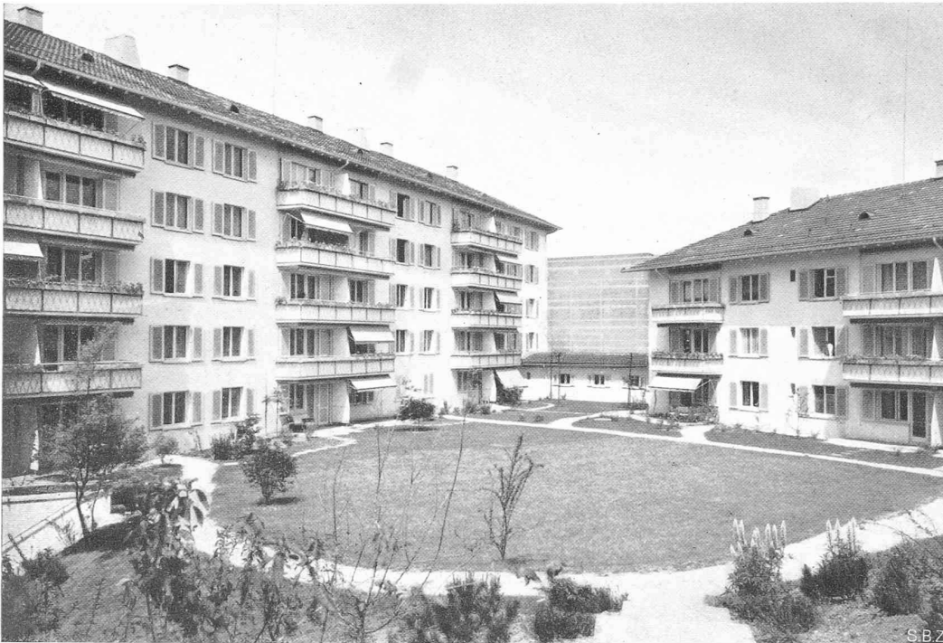
Bild 1. Der grosse Gartenhof des «Utopark» in Zürich aus Südosten