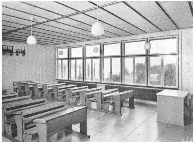
Bilder 23 und 24. Schulpavillon am Richard Wagnerweg (Nr. 12 in Bild 9), STÄDT. HOCHBAUAMT. Grundriss 1 : 300