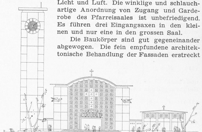
1. Preis. Ostfassade von Turm, Kirche und Altarkapelle 1 : 600

Die Baukörper sind gut gegeneinander abgewogen. Die fein empfundene architektonische Behandlung der Fassaden erstreckt