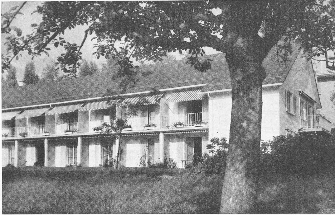
Bild 14. Das Apartmenthouse aus Südwesten Arch. ALBERT JENNY, Zürich