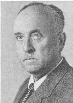
G. LEUENBERGER ARCHITEKT

Als im Jahre 1922 die Ortsgemeinde infolge Sparmassnahmen die Stelle eines Architekten aufhob, gründete Lang ein eigenes Architekturbureau, mit dem er dank seiner aussergewöhnlichen Energie und seiner soliden Berufsauffassung sich bald die Wertschätzung seiner Auftraggeber erwarb. Zahlreiche Wohnbauten besten Stils zu Stadt und Land ent-