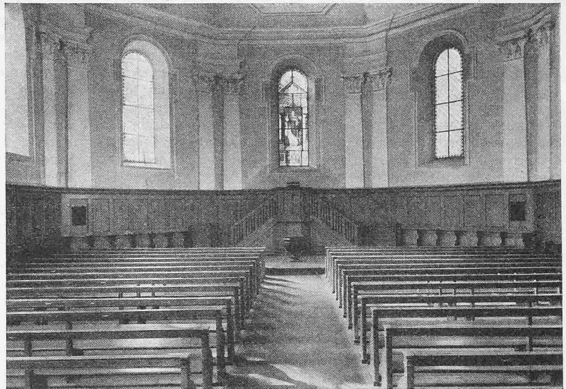
Ansicht gegen die Kanzel vor der Restauration (vgl. Tafel 21)

Noch während der Bauzeit wurde auf Anregung von Dr. Stettler beschlossen, auch die bestehende Emporenbrüstung abzutragen und durch eine neue, dem barocken Charakter entsprechende, zu ersetzen. Im Verlauf der Umbauarbeiten nahm die Orgel, trotz allen möglichen Vorkehrungen zu ihrem Schutze, erheblichen Schaden. Eine gründliche Reinigung und eine Neintonierung wurden notwendig. Diese zusätzlichen Arbeiten und die Ausgaben für die Aussenrenovation und die Umgebungsarbeiten erforderten einen neuen