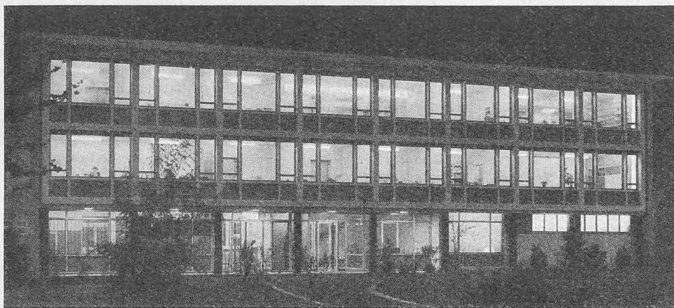
Bild 12. Obstverbandgebäude in Zug, Nachtaufnahme der Strassenfront