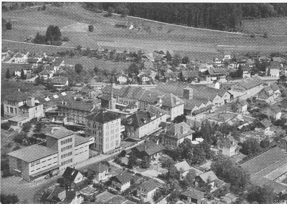
Bild 1. Fliegerbild der «ASTRA» Fett- und Oelwerke AG. in Steffisburg

Bild 1 gibt einen Ueberblick über die gesamten Neuanlagen nach Fertigstellung der hier beschriebenen Neubauten, während im Lageplan (Bild 2) die Neubauten besonders hervorgehoben sind.