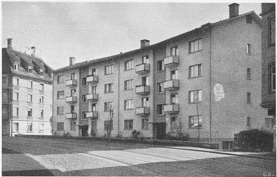
Bild 6. Fassade an der Forchstrasse aus Norden

Schwellen sind aus Holz und stammen zum Teil aus Kanada, werden aber auch eingeführt. Das Holz der Gegend ist krumm gewachsen und deshalb nur teilweise brauchbar. Die totale Bauzeit beträgt voraussichtlich drei Jahre.