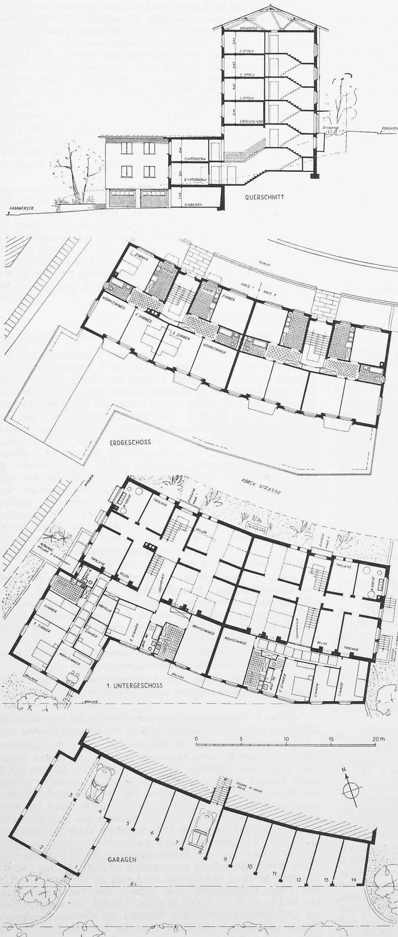
Bilder 1 bis 4. Doppelmehrfamilienhaus an der Forchstrasse in Zürich; Grundrisse und Schnitt 1:400

Ueber die Ausbeutung der Eisenerzfelder im Westen Labradors haben wir 1951 auf S. 362 berichtet. Nunmehr bringt «Engineering News-Record» vom 11. Sept. 1952 Einzelheiten über den Bau der Bahn, die die Erzlager von Knob Lake mit dem Umschlagplatz Seven Islands an der Südküste verbinden soll. Die projektierte Strecke misst rd. 600 km. Der südliche Ausgangspunkt ist nur zu Schiff erreichbar, und auch das nur, wenn der St. Laurentz-Golf eisfrei ist.