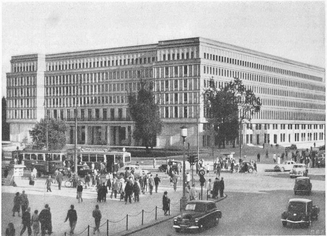
Bild 3. Gebäude der polnischen Arbeiterpartei in Warschau

Aquädukt aus Leichtmetall. Durch ein schweres Unwetter wurde beim Kraftwerk Borgne der Aluminium-Industrie AG., Chippis, ein eiserner Aquädukt über einen Wildbach zerstört, für dessen Wiederherstellung Anticorodal-B mit hoher Festigkeit und grosser Korrosionsbeständigkeit verwendet wurde. Vergleichende Kostenberechnungen für die Ausführung dieses Bauwerkes aus Eisenbeton oder Stahl haben im vorliegenden Fall dem Leichtmetall den Vorzug gegeben. Bei diesem Entscheid waren die kurze Montagezeit wegen der erforderlichen Ausserbetriebsetzung des Kraftwerkes und die geringen Transportkosten von ausschlaggebender Bedeutung. Weitere Vorteile dieses Baumaterials kommen durch die voraussichtlich geringen Unterhaltskosten und eine fast unbeschränkte Lebensdauer zum Ausdruck. In der Fachzeitschrift «Aluminium Suisse» Nr. 4 vom Juli 1952 werden Einzelheiten der Konstruktion dieses Bauwerkes mit guten Abbildungen veröffentlicht. Es handelt sich um einen oben offenen, 10,6 Meter langen, rechteckigen Kanal mit lichten Querschnittsabmessungen von 1,7×2,04 m. Bemessen für eine totale Wasser-