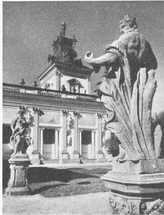
Bild 2. Teilstück des Palastes in Wilanow bei Warschau, erbaut 1678 bis 1694. Arch. A. LOZZI