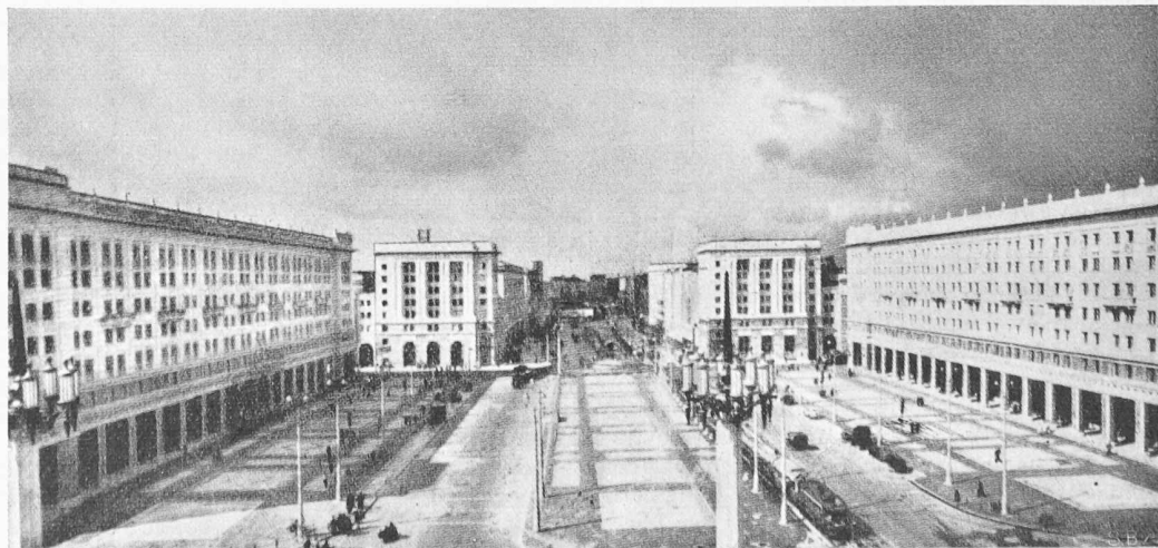
Bild 6. Platz der Verfassung im Wohnquartier Marszalkowska in Warschau Architekten ST. JANKOWSKI, J. KNOTHE, J. SIGALIN und Z. STEPINSKI