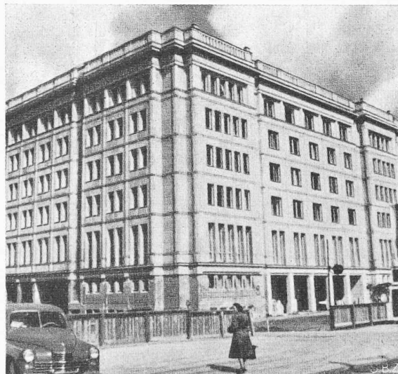
Bild 4. Bürohaus in Warschau, Arch. ST. BIENKUNSKI und ST. RYCHLOWSKI