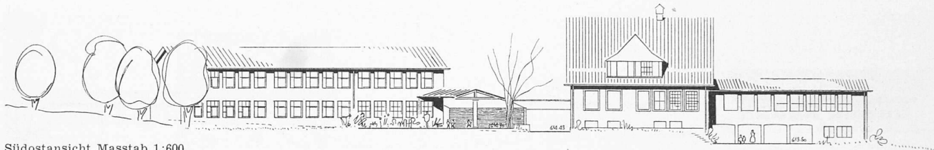
Südostansicht Masstab 1:600