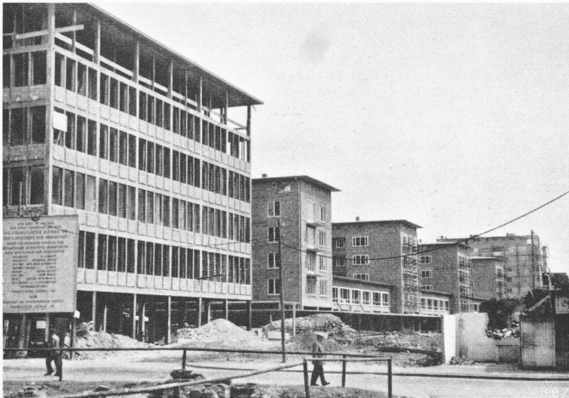
Bild 3. Entstehen eines ganzen neuen Wohn- und Geschäftshausquartiers. Tiefengestaffelte Baublöcke mit querverbindender Ladenstrasse