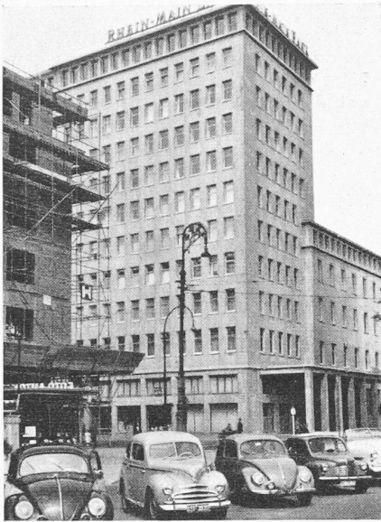
Bild 6. Das neue Gebäude der Rhein-Mainbank am Friedrich-Ebert-Platz. Konventionelle, aber gut proportionierte Architektur