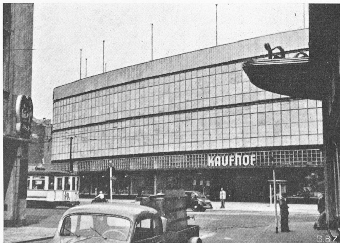
Bild 9. Modernstes Kaufhaus. Keine Oeffnungen nach aussen. Maximaler Lichteinfall. Klimaanlage regelt Temperatur und Feuchtigkeit der Luft im Innern