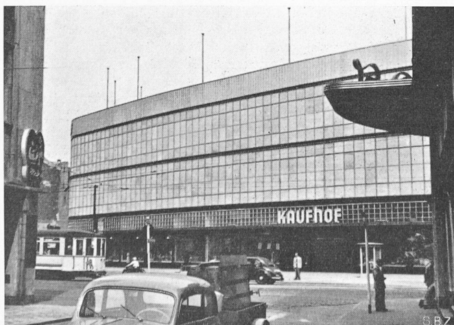
Bild 9. Modernstes Kaufhaus. Keine Oeffnungen nach aussen. Maximaler Lichteinfall. Klimaanlage regelt Temperatur und Feuchtigkeit der Luft im Innern