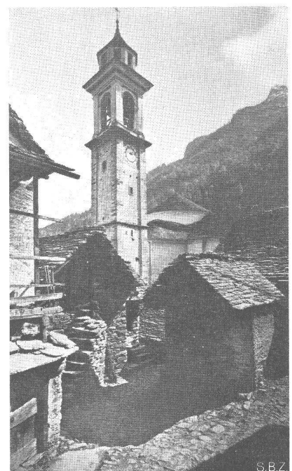
Sonogno, Val Verzasca