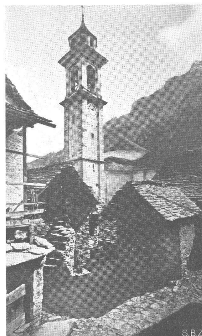
Sonogno, Val Verzasca