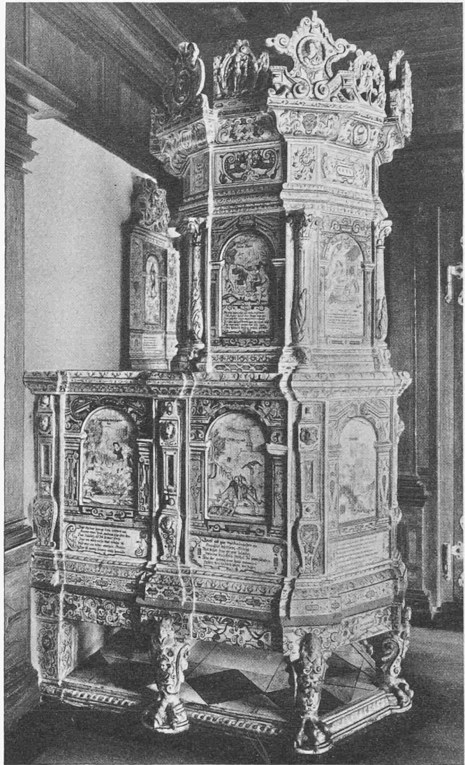
Ofen im Schweizerischen Landesmuseum in Zürich, 1636 von David Pfau für das Haus zum Lorbeerbaum an der Marktgasse in Winterthur gemalt

Erfreulicherweise sind auch die zu Unrecht heute geringgeschätzten Bauten des Spätklassizismus in die Darstellung aufgenommen, so das ehemalige Alte Gymnasium, von 1838 bis 1842, dessen Fassade durch den Umbau zum Reinhart-Museum allerdings einiges von ihrem Charme verloren hat. Ebenfalls von Leonhard Zeugheer, dem Erbauer der Neumünsterkirche in Zürich, stammte das (abgebrochene) Eggsche Gut; spätklassizistisch auch der schöne «Adlergarten» von 1833. Am Uebergang vom Spätklassizismus zur Neurenaissance steht das Stadthaus von Gottfried Semper, 1865 bis 1869, hart und splittig-spröde, überwach in der Präzision seiner Details und seiner mager-schlanken Proportionen, ein Inbegriff seiner Stilrichtung von internationaler Bedeutung, leider etwas entstellt durch die Verlängerung des Baukörpers