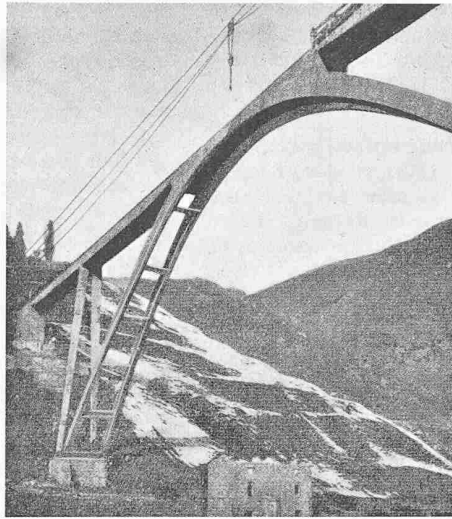
Bild 1. Eisenbetonsteg von Vagli di Sotto

Ohio-Turnpike. In den USA ist zurzeit eine neue Autobahn quer durch den Norden des Staates Ohio, zwischen den Grenzen von Pennsylvania und Indiana, im Bau. Die Baukosten der insgesamt 388 km langen Strecke werden sich auf 326 Mio Dollar belaufen. Die letzten der 62 Bauabschnitte, für deren komplette Ausführung jeweils ein Unternehmer allein verantwortlich ist, sollen zum 1. Oktober 1955 dem Verkehr übergeben werden, d. h. nach einer Bauzeit von nur rund zwei Jahren. Die Strecke erhält 15 Einmündungen bzw. Abzweigungen zum Anschluss an wichtige Industriestädte und bestehende Fernverkehrsstrassen. Das Längenprofil weist maximal 2 Prozent Steigung und 4 Prozent Gefälle auf. Der Querschnitt besteht aus zwei getrennten, parallelen Fahrbahnen, von denen jede 7,32 m breit ist und von einer 25,4 cm