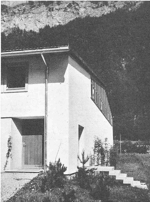
Bild 1. Eckpartie auf der Nord/Ostseite