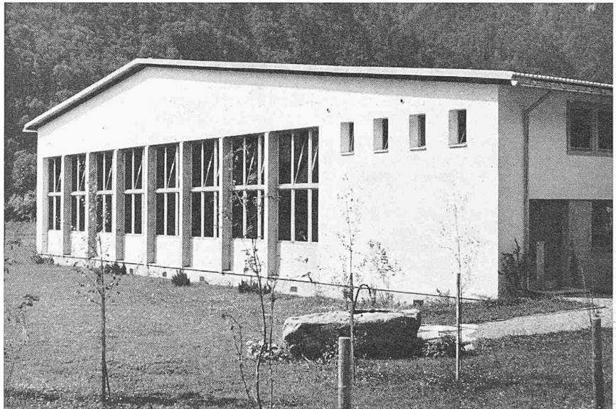
Bild 4. Südfassade