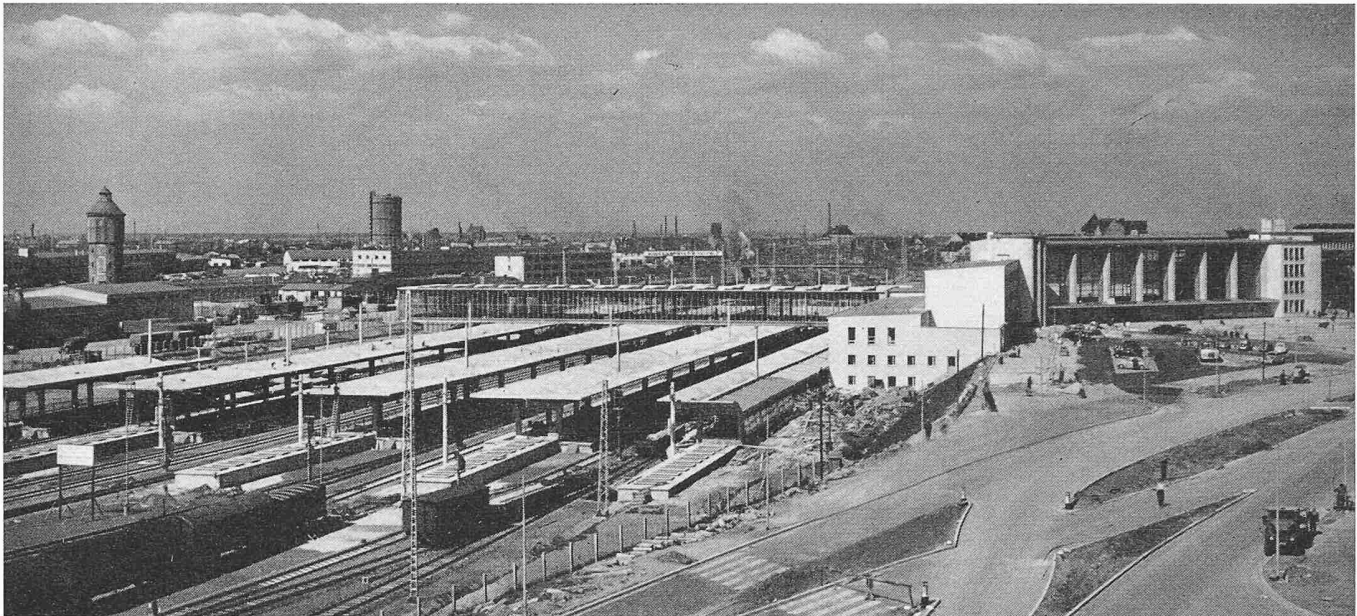
Bild 3. Gesamtansicht der Bahnsteige mit Empfangsgebäude

melde- und Signaltechnik in der Zwischenzeit erhebliche Fortschritte gemacht hatte; diese ermöglichten es, den neuen Bahnhof als Durchgangsbahnhof nicht mit zwanzig, sondern — bei gleicher Leistungsfähigkeit — nur mit sieben bis acht Perrons auszustatten; auch von selbständigen Gepäckperrons ist man heute wieder abgekommen. Ebensovienig benötigt man heute noch ein Dutzend oder mehr Stellwerke wie ehemals. Ein einziges Drucktasten-Zentralstellwerk lenkt den Zugs- und Rangierdienst innerhalb des ganzen Bahnhofes. Während im alten Bahnhof vier mechanische Stellwerke und sechs Bodenwärterposten mit rund 45 Bediensteten nötig waren, wird der gesamte Fahrdienst im neuen Bahnhof von einer Stelle aus geleitet, die mit einem Fahrdienstleiter und einem Weichenwärter besetzt ist.