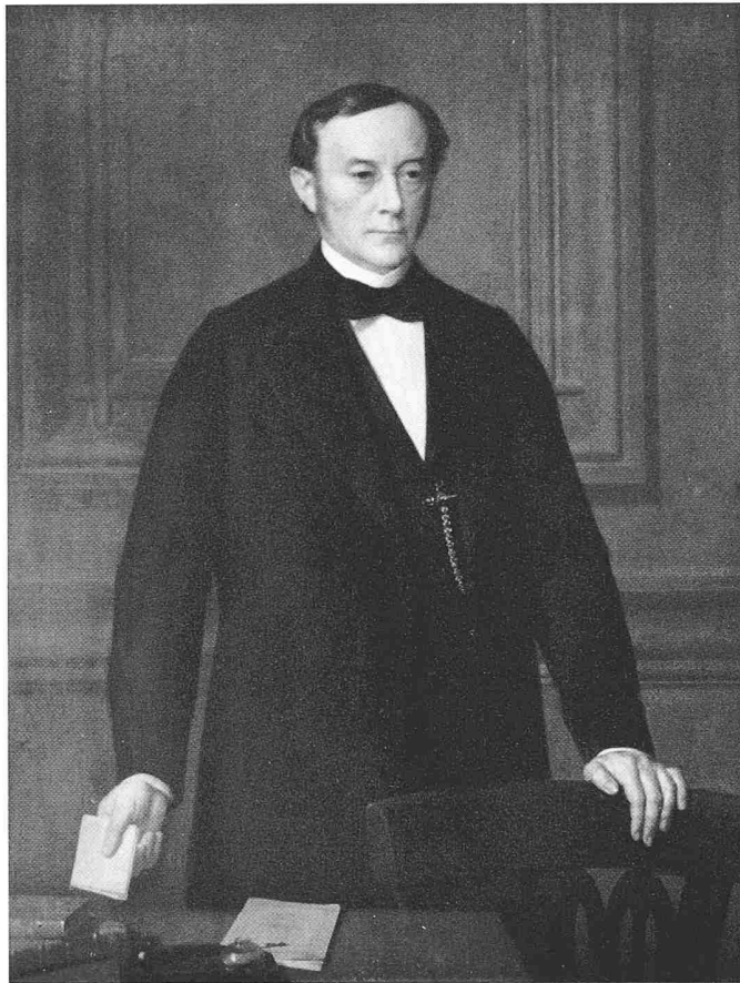
JOHANN KONRAD KERN

Am Polytechnikum hat man einen grundsätzlich andern Weg eingeschlagen: Die Elite, zu der die Studierenden herangebildet werden sollten, war nicht als Gegenpol zu den in Industrie, Gewerbe, Handel und Verkehr tätigen Volksschichten und Interessengruppen gedacht, sondern als die sie führenden Männer. Dazu musste sie in erster Linie über eine solide und gegenüber dem Bisherigen überlegene fachtechnische Bildung verfügen. Diese beschränkte sich nun aber nicht auf die Kenntnis der Theorien und der einschlägigen Disziplinen, noch weniger auf eine Meinungsbildung durch Logik und Rhetorik, sondern sie bestand in wesentlichen Teilen im Erarbeiten experimenteller Erkenntnisse und im Heranbilden der Fähigkeit, technische Aufgaben, die ja auch immer Lebensaufgaben einschliessen, durch freies, schöpferisches Gestalten von naturhaft Gegebenem zu lösen.