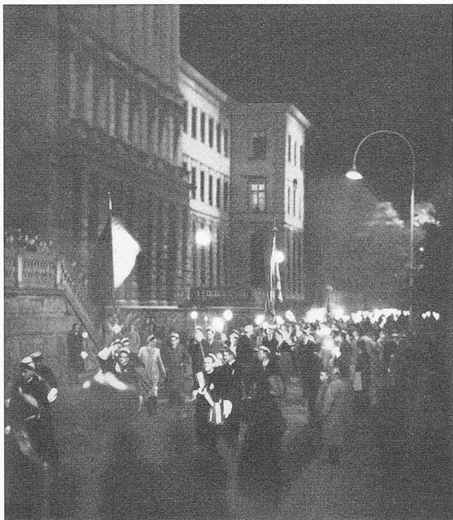
Aufbruch des Fackelzuges der Studenten vor dem Semperbau der ETH am Abend des 19. Oktober 1955