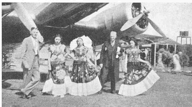
Bild 25. Im Grenzdorf zwischen Mexiko und Guatemala war gerade Kostümfest und die Dämchen liessen sich mit uns photographieren