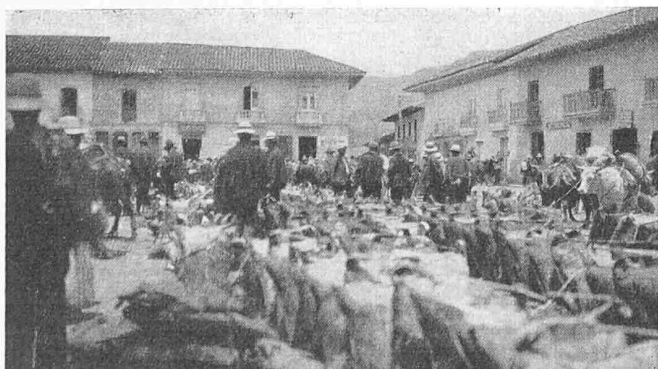
Bild 24. Marktszene in Kolumbien; in den Säcken, aus Häuten genäht, ist flüssiger Zucker, aus Rohr gekocht