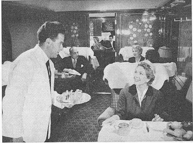
Fig. 16. Intérieur d'une voiture Pullman (type Flèche d'Or) de la CIWL. deux, grâce à une porte ménagée dans la cloison de séparation.

immédiat. Ce train est climatisé et il comporte dans la voiture de queue un salon à vision panoramique. Cette rame est donc l'une des plus remarquables en Europe.