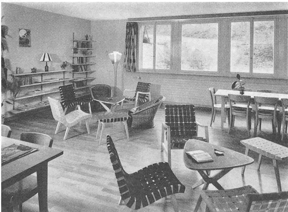
Saal der Jugendgruppe im Untergeschoss

Kanzel, Abendmahlstisch und Blumenkrippe, die auf einem Podest im vorderen Teil des Gemeindesaales stehen, sind abnehmbar, denn der Raum hat verschiedenen Zwecken zu dienen. Ausser dem Gottesdienst werden hier auch gesellige Zusammenkünfte, Konzerte und Filmabende das Gemeindeleben