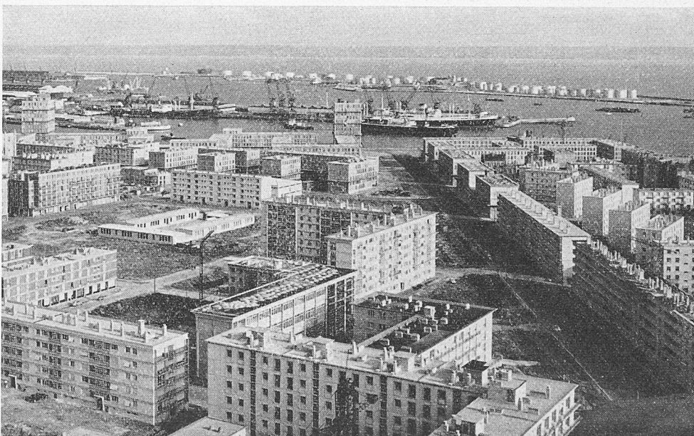
Le Havre, immeubles entre Rue de Paris et Bd. Clemenceau