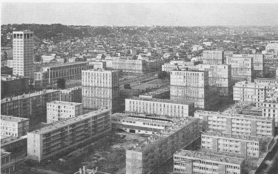
Le Havre, ensemble I. C. E., de l'Hôtel de ville