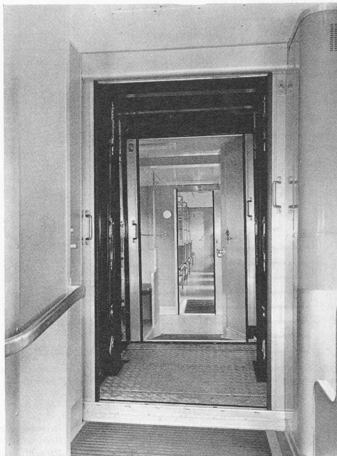
Bild 10. Blick durch einen Wagenübergang

für je vier Plätze 130 bis 150 Lux erreicht. Für den Betrieb vorteilhaft ist der Umstand, dass dank dieser Beleuchtungsart die nötigen Batterieauswechslungen stark verringert werden können.