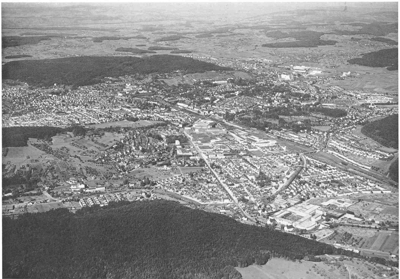
Flugbild aus West/Südwest, Juni 1950. Im Vordergrund Töss mit Fabrik Rieter; Bildmitte Fabrikareal Sulzer und Lokomotivfabrik, etwas höher und rechts die von Parks umgebene Altstadt, dahinter Oberwinterthur mit der neuen Industriezone; Bildmitte links Veltheim. Im Hintergrund Frauenfeld und Thurtal. Die Talsohle von Winterthur ist dicht besiedelt, die Molassekuppen und ihre Nordhänge sind bewaldet; an den steilen Südhängen finden sich noch spärliche Ueberreste der früheren ausgedehnten Rebberge (Zum Aufsatz von E. Krebs)