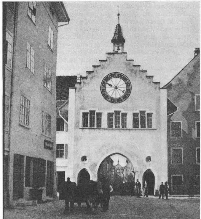
«Oberer Bogen» in Winterthur. Ursprünglich Torturm, dann Zunfthaus der Oberstube am Graben. Blick nach Westen auf den «unteren Bogen». Aufnahme kurz vor der Niederlegung 1870.

Das formen- und farbenreiche Bild der torreichen Stadt hatte sich auf Jahrhunderte fast unverändert erhalten. Doch bahnte sich seit 1750 eine tiefgreifende Aenderung an, die im 19. Jahrhundert zum Durchbruch kam. Im Jahre 1669 hatte der Rat, trotz dem Unwillen der Bürger, einen ersten Hausbau vor den Toren erlaubt. Allmählich entstanden dasselbst Landhäuser, die zum Teil schon wieder niedergelegt sind, zum Teil nicht mehr privaten Zwecken dienen: das