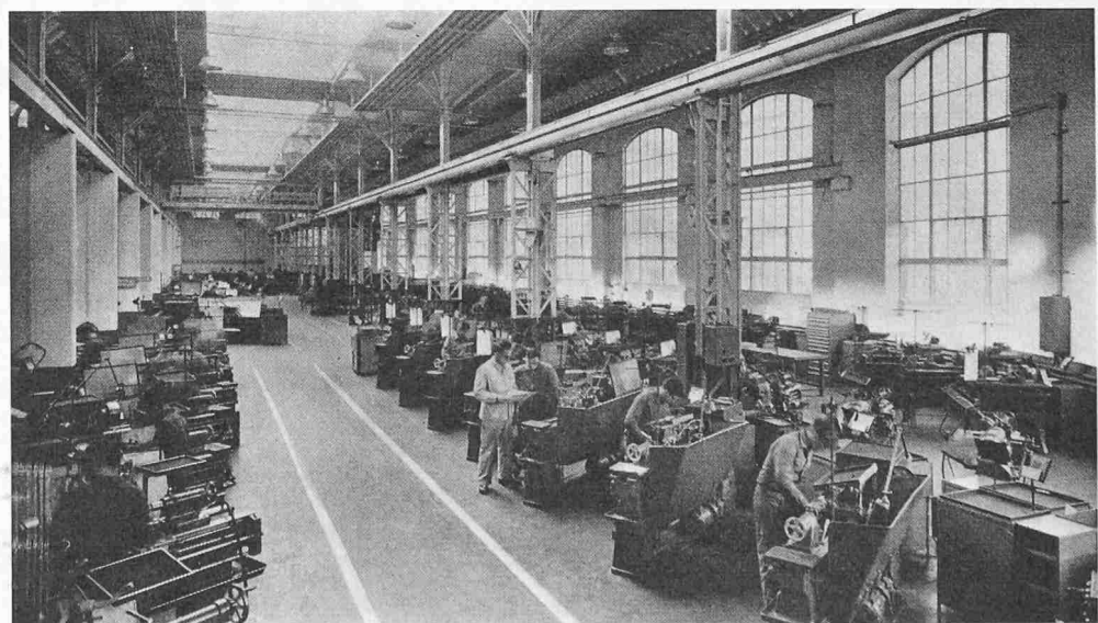
Bild 1. Beispiel einer Lehrwerkstatt für die Metallbearbeitung mit 300 Arbeitsplätzen