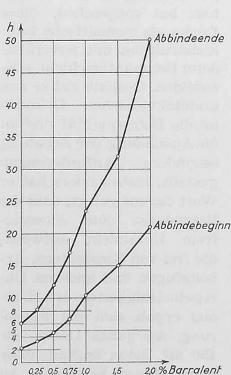
Bild 1. Verzögerung der Betonabbindezeit bei Beton mit Zement Liesberg PC 300 bei einer Lufttemperatur von 18 bis 20° C durch die Beimischung von Barralent

Die Festigkeit wird durch den Verzögerer hauptsächlich in den ersten Tagen beeinflusst. Je nach der Dosierung erreicht der Beton nach 3 bis 14 Tagen die normale Festigkeit,