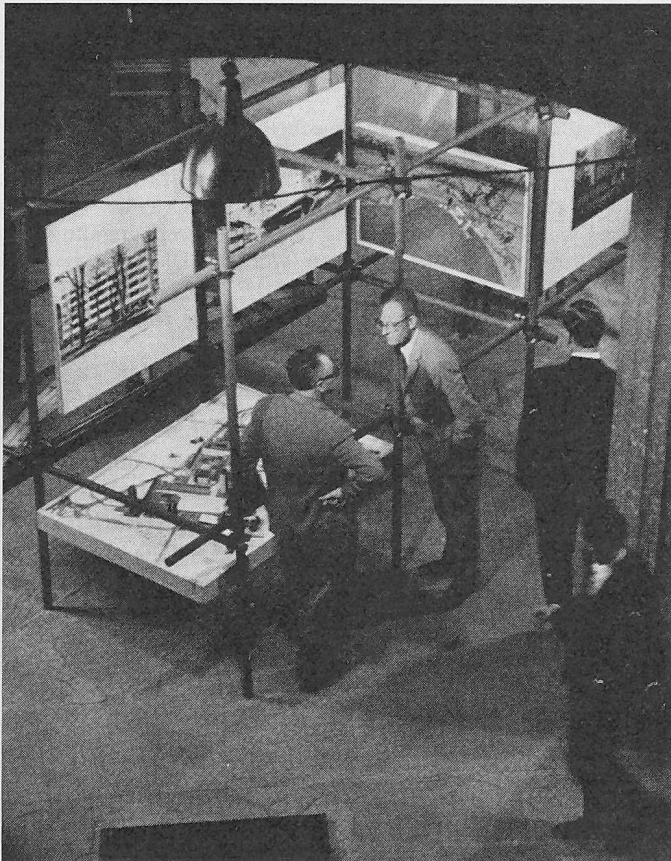
Links: Blick in die Ausstellung der S. I. A.-Sektion Neuenburg im Hôtel de ville