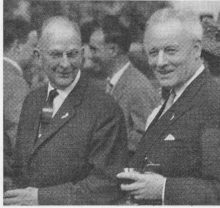
Bundesrat Streuli u. Regierungsrat Zschokke