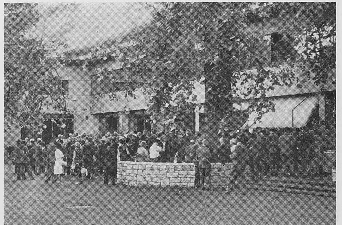
Im Garten der Universität am 22. Juni

Die Kongresshalle der Mustermesse eignete sich vorzüglich als Rahmen für den Festakt vom Sonntag, 24. Juni , den das Basler Kammerorchester unter der Leitung von Dr. P. Sacher mit der Suite und Ouvertüre des ersten Aktes aus «The Fairy Queen» von Henry Purcell eröffnete. Der Begrüssungsansprache des Präsidenten, die im nächsten Bulle-