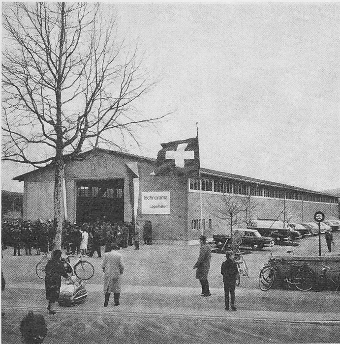
Einweihung der Lagerhalle 1 des Technorama Winterthur am Samstag, 7. April 1962