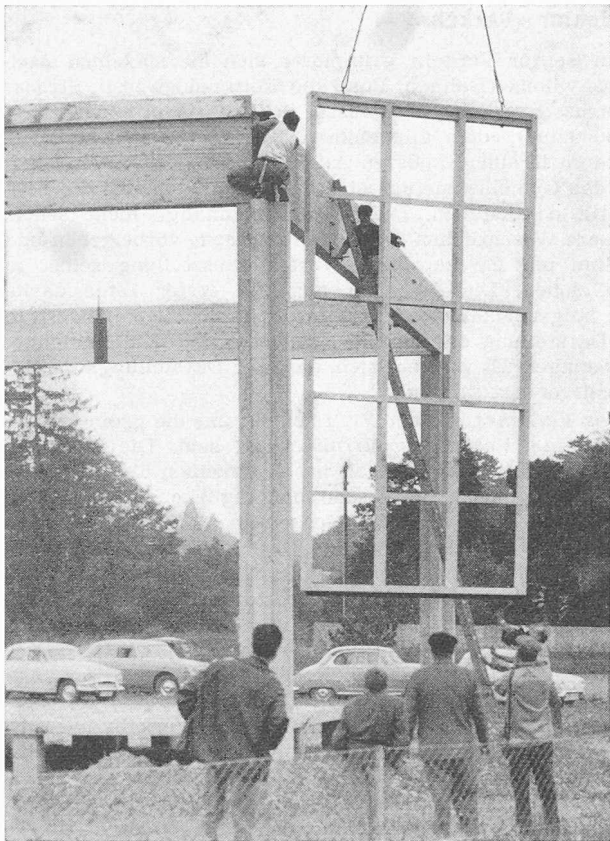
Verkehr. Montage eines Deckenelementes

Die Antwort wird in einem geräumigen Kuppelbau gegeben, der bereits durch seine Form und den architektonischen Innenausbau das Wesentliche symbolisiert — nämlich die Harmonie der Verkehrsmittel. Die «Botschaft» lautet in Worten: «Die Verkehrsmittel bilden ein Ganzes. Jedes Verkehrsmittel soll dort eingesetzt werden, wo es die grössten Dienste leistet. Vorsehen — organisieren — anpassen, durch freiwillige Zusammenarbeit!» Sind wir uns darüber im klaren, dass diese an der Expo erstmals propagierte These seitens der Verkehrsträger ein beachtliches Zugeständnis für die Gestaltung der Schweiz von morgen bedeutet.